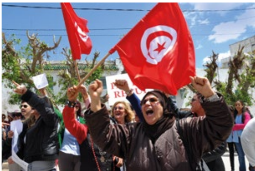
Des femmes manifestent devant l'Assemblée constituante tunisienne, et réclament la parité dans la loi électorale, Tunisie (2014).

À l'heure actuelle, les inégalités extrêmes nuisent à tous. Elles ne permettent pas aux personnes les plus pauvres dans la société, qu'elles vivent en Afrique sub-saharienne ou dans le pays le plus riche du monde, de sortir de la pauvreté extrême et de vivre dans la dignité.